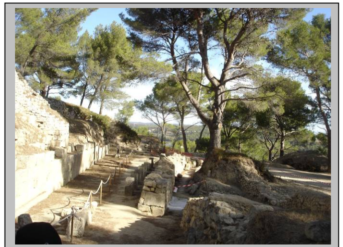
Le rempart hellénistique

Et c'est donc à sa suite que l'on découvrait les vestiges de cette ancienne ville fortifiée, par les gaulois d'abord, les grecs ensuite et enfin, après plusieurs siècles d'abandon, une troisième fois au temps de la christianisation de la Provence. Nous suivons, sur un terrain inégal, la "courtine" de 400 m de long qui liait les 3 tours des fortifications. Protégé par un avant mur, le rempart grec est particulièrement remarquable avec ses blocs taillés à la perfection qui, de ce fait s'empilaient sans besoin de liant. On découvrait les villes basse et haute, reproduites sur des panneaux, permettant de visualiser les lieux tels qu'ils étaient à cette époque.