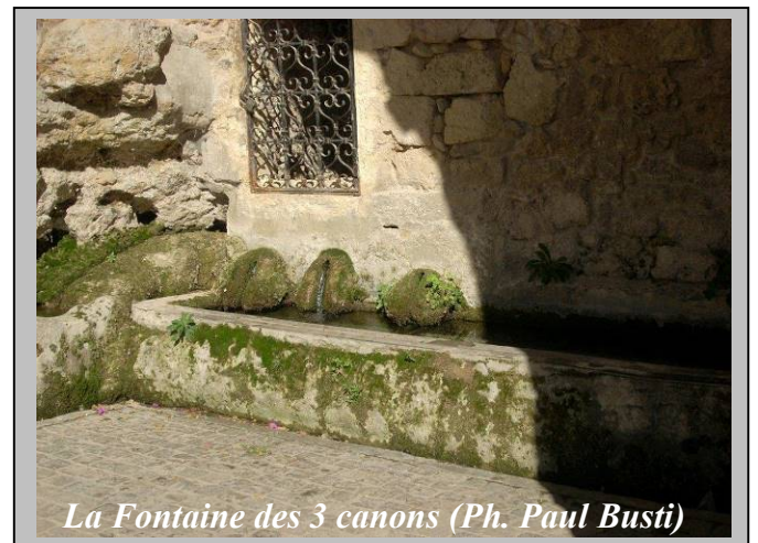
La Fontaine des 3 canons

- La Maison des Consuls et sa porte Louis XIII qui date de 1654.