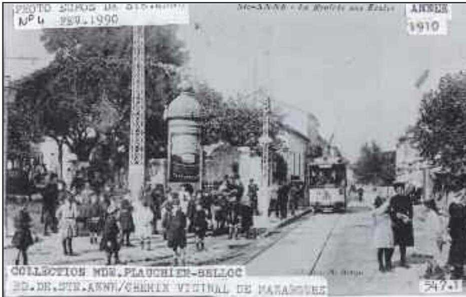
Sainte-Anne, Bd de Sainte Anne - Chemin Vicinal de Mazargues. Soit 88 ans plus tard.