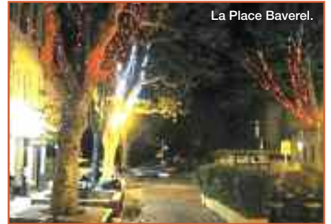
La Place Baverel.

On peut aussi imaginer d'autres initiatives de ce genre à d'autres moments de l'année et les commerçants du bas et du haut de l'avenue de Mazargues ainsi que ceux du Parc Hermès pourraient de cette façon participer au mouvement d'ensemble et à ces initiatives.