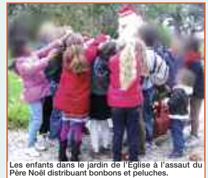
Les enfants dans le jardin de l'Eglise à l'assaut du Père Noël distribuant bonbons et peluches.

C'est le CIQ qui avait fait la lettre pour lui demander de passer dans notre Quartier. Il est venu un peu avant la Noël les 18, 19 et 20 décembre. Il est passé dans les rues de Sainte-Anne, distribuant aux enfants des bonbons, papillotes et des petites peluches, se signalant de l'extérieur aux commerçants pour ne pas les déranger dans leurs activités, il est également passé dans la cour de l'église où il y avait un groupe d'enfants qui préparaient les festivités de Noël et qui l'ont assailli pour obtenir les présents qu'il distribuait (voir photo).