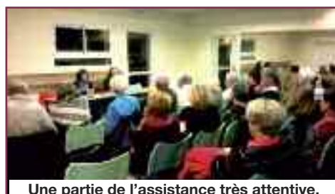
Une partie de l'assistance très attentive.