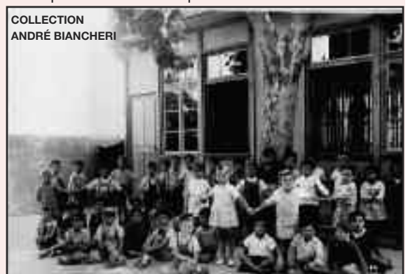
ECOLE DE STE ANNE RUE THIEUX - ANNÉE 1951-1952