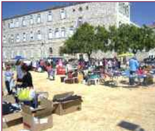
Une vue de l'ensemble de cet espace devant les magnifiques bâtiments de l'Association FOUQUE qui héberge les 2 associations Les Ecureuils et Les Saints Anges.

Ce fut le cas lors de notre visite au Mémorial des Milles le 18 mai dernier, et ce fut la même chose ce dimanche de septembre, quand, après des mois de ciel d'azur et de soleil rayonnant, les éléments se sont tout à coup déchainés sur Marseille. Cela n'a duré que quelques heures, mais suffisantes toutefois pour remettre en cause deux mois de préparation, des dépenses non négligeables et la mise en place d'une organisation à laquelle, cette fois réellement, "il ne manquait pas un bouton de guêtre"... Et, la mort dans l'âme on voyait subitement notre projet "tomber à l'eau", sans mauvais jeu de mots malheureusement !... A 6 h 30, moment d'ouverture des portes aux participants, c'est donc sous une pluie battante qu'une équipe d'une quinzaine de bénévoles dirigeait, tant bien que mal, chacun vers l'emplacement qui lui avait été dévolu. Et malgré ces conditions dantesques, c'est finalement sans trop de problèmes que se déroulait ce qui constitue la phase la plus critique d'un vide grenier : la mise en place des expo-