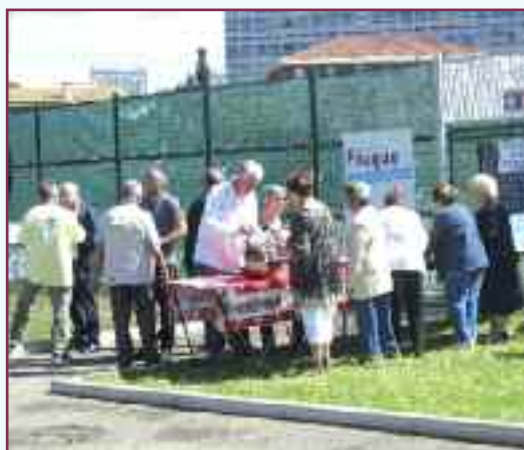
On s'affaire pour préparer la table du cocktail qui va bientôt recevoir Organisateurs, Elus, Exposants et Visiteurs.