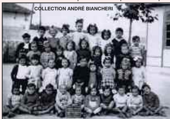
ECOLE DE STE ANNE RUE THIEUX - ANNÉE 1951-1952