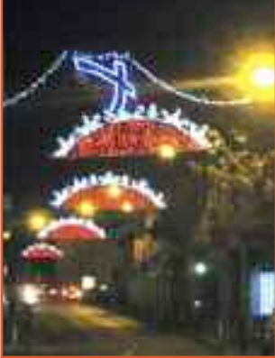
L'Avenue de Mazargues.