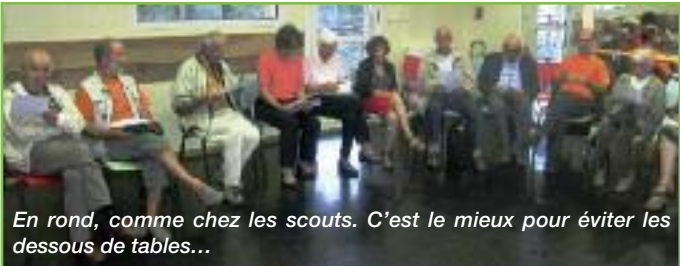
En rond, comme chez les scouts. C'est le mieux pour éviter les dessous de tables...

C'est le rendez-vous annuel, incontournable, de toute association et c'est l'occasion de faire le bilan de l'année écoulée et d'avancer des projets pour les mois futurs.