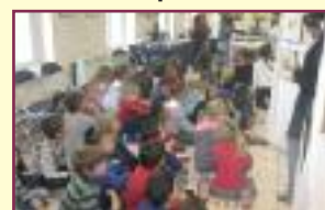
Les élèves d'une classe C.E. de l'Ecole Privée assis en rond écoutant les explications de leur maîtresse avant de désigner leur lauréat.