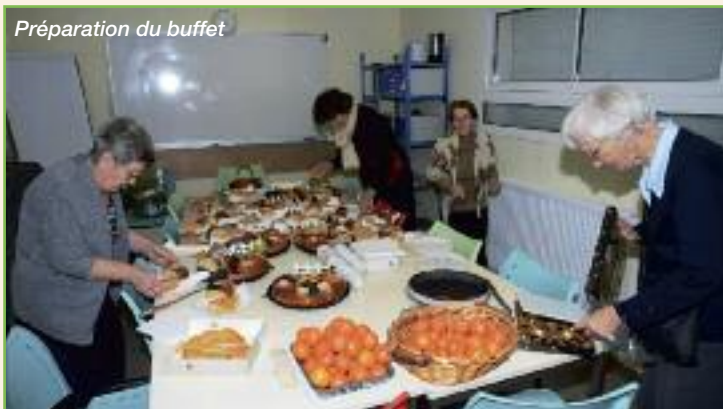
Préparation du buffet