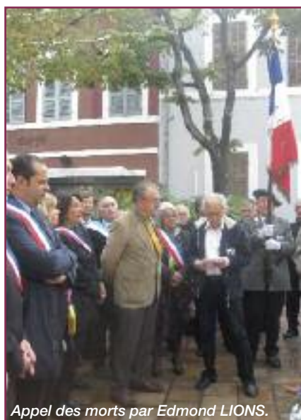
Appel des morts par Edmond LIONS.

On peut aussi citer une moyenne 6221 tués par jour au cours de cette guerre.