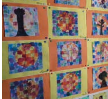
Des tableaux peints par les élèves de la classe CP1