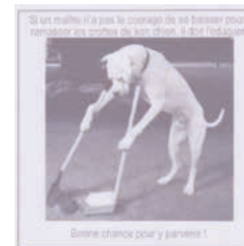
Image humoristique pour inciter les propriétaires de chiens à enlever les déjections de leur animal de compagnie, à moins de lui apprendre à le faire lui même...

quelques slogans utiles : Le téléphone au boulot, c'est normal, au volant, ça tourne mal/ Sur la route aussi attachez vos ceintures/ vérifiez la pression de vos pneus/ Vous pouvez vous arrêter pile, une voiture ne le peut pas/ Il y a mille et une manières de communiquer, au volant c'est le clignotant. Ces principes de base peuvent éviter les accidents.