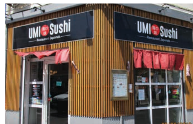
Photo de le devanture faisant angle entre l'avenue de Mazargues et le bd Ste Anne

Carte de fidélité à partir du 4ème repas.