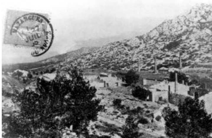
Mazargues : les fabriques année 1905