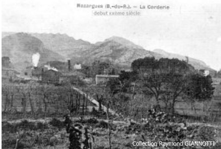
Vue des usines au début du XXème siècle