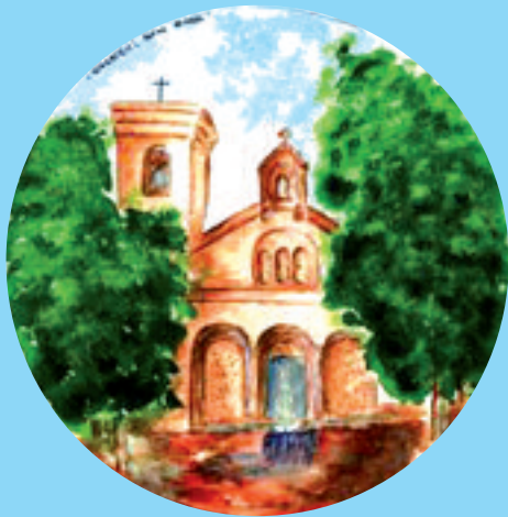
Maquette : Frédéric Gilly / Illustration : Anne-Marie Orsatelli-Leduc