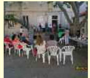
Remise des prix dans la Cour de la Maison de Quartier. A droite : le buffet tenu par Mémène Pourcin