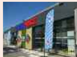
Vue de la façade avec le nouveau logo rouge et bleu.