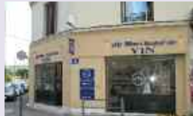
La nouvelle vitrine fait l'angle Avenue de Mazargues / Bd Luce.

Non elle ne vient pas d'ouvrir car elle est installée depuis 48 ans – Qui dit mieux ? Félicitations du CIQ de Ste Anne