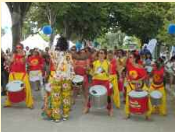
Un groupe de "percussions" dans les allées Impossible à manquer à moins d'être sourd...

C'est une journée incontournable dans l'agenda des associations. Elles étaient au moins 400 dans les allées du parc BORELY, démontrant ainsi la richesse de mouvement associatif qui est reconnu comme essentiel dans notre société actuelle.