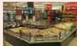
Vues de l'intérieur et des rayons "nouveaux concepts"