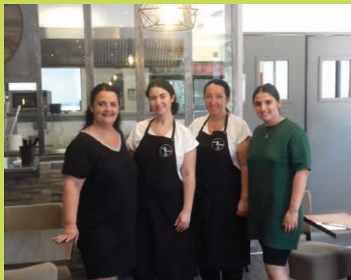
Photo de l'Equipe féminine de la Casa TIBIKA que nous remercions vivement.

Nous étions près de 50 pour ce repas de début d'année le samedi 7 mars 2020, et la chance était avec nous puisque, à quelques jours près il aurait été annulé pour cause de confinement obligatoire décrété. Tout s'est déroulé parfaitement bien et tous les participants ont été satisfaits et de la cuisine et de l'accueil. Et puis nous avons pu profiter de l'animation musicale de WILLY que nous avons eu grand plaisir à retrouver après les moments difficiles qu'il a subis au plan personnel. Il nous faut renouveler ces occasions de rencontre et de convivialité qui sont si importants pour tous les Groupes et Associations, la période que nous avons traversée ne peut que renforcer notre désir et notre envie de nous retrouver ainsi.