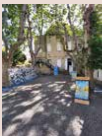
Mme MC. LATIL

Une très belle exposition organisée par le CIQ avec le soutien de la mairie du 6/8